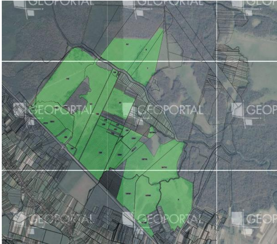
Karta 1. Prikaz obuhvata ZP Odransko polje

ZP Odransko polje je ukupne površine 759,8019 ha, a obuhvaća površine trajnih travnjaka iza naselja Greda, Sela i Stupno. Prostorno je smješten sjeveroistočno od željezničke pruge Sisak-Zagreb do toka rijeke Odre, te se djelomično proteže i na lijevu obalu Odre.