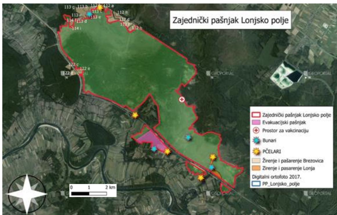
Karta 2. Kartografski prikaz infrastrukture na ZP Lonjsko polje

Prema Programu gospodarenja gospodarskom jedinicom „Lonja“ sa planom upravljanja područjem ekološke mreže od 2018. – 2027. godine žirenje i pašarenje je dozvoljeno u odsjecima 52a i 52f.