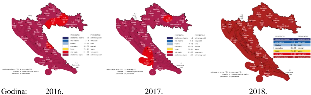
Slika 2. Odstupanje srednje temperature zraka od 2016. do 2018. godine

U takvim uvjetima pčelinje zajednice podložnije su obolijevanju od pčelinjih bolesti, a zbog nesigurnih i nestalnih izvora hrane u prirodi pčelinje zajednice ne mogu opstati bez intervencije pčelara što iziskuje dodatne financijske troškove pčelarima.