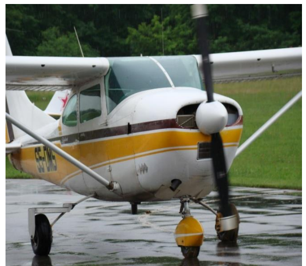
Slika 2. Zrakoplov za distribuciju mamaka

Iz zrakoplova se, pomoću specijalnih uređaja s ugrađenim GPS sustavom i posebno dizajniranim softverom, izbacuje jedan po jedan mamak na slijedeći način: