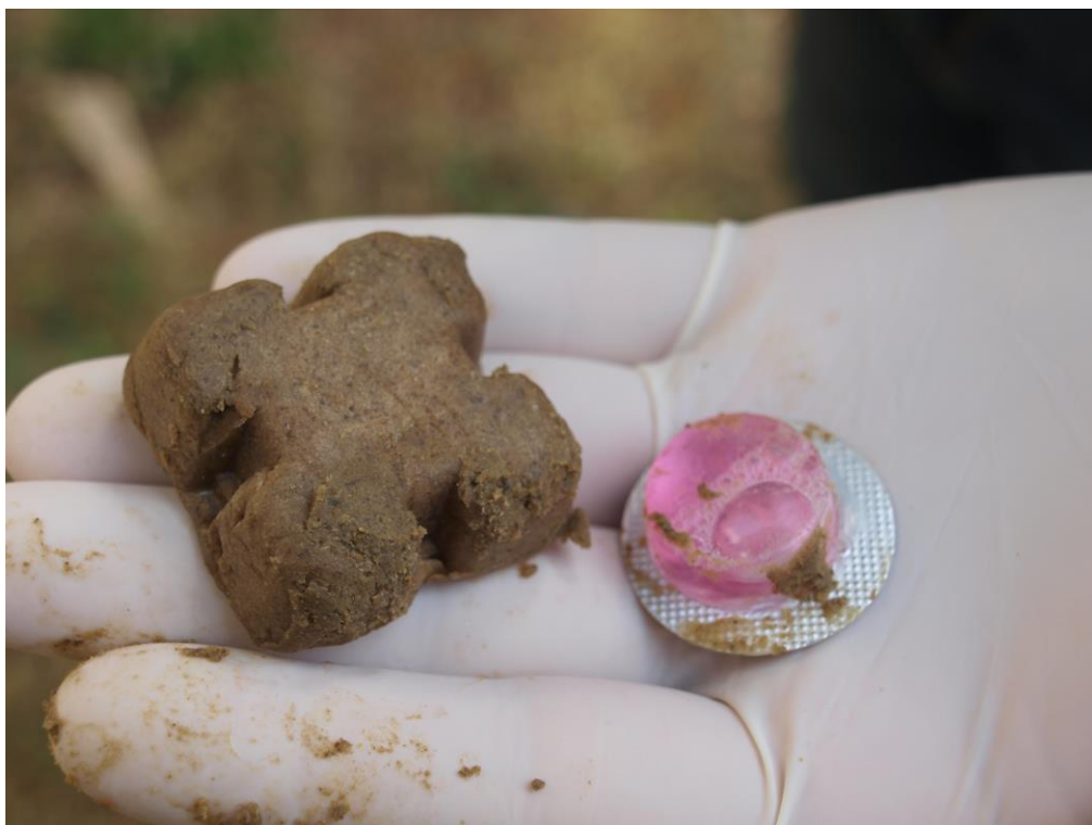
Slika 3.- Vakcinalni mamak i pvc kapsula sa cjepivom

Cjepivo je u obliku otopine upakirano u plastično-aluminijsku kapsulu koja se nalazi u središtu hranjivog mamka. Mamak je izrađen od smjese ribljeg brašna te ima specifičan i intenzivan miris i okus koji je privlačan za divlje životinje. Tamno-smeđe je boje i izgledom podsjeća na kolačić. Privučene mirisima, lisice pronalaze mamke, zagrizu ih i probiju kapsulu. Dolaskom sluznice usta u dodir sa otopinom cjepiva započinje djelovanje cjepiva na imuni sustav životinje te u razdoblju od 21 dan životinje razviju imunitet koji ih štiti od bjesnoće najmanje 12 mjeseci. Mamak sadrži antibiotik tetraciklin koji se odlaže u zubima te predstavlja marker koji služi za dokaz da je lisica imunizirana.