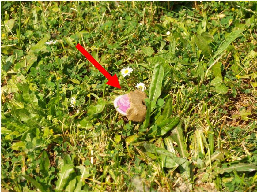
Slika 4.- Oštećeni vakcinalni mamak u prirodi

Područje Hrvatske na kojem se provodi polaganje mamaka u razdoblju 30. 03. – 02. 04.2021. godine (proljetna akcija oralne vakcinacije lisica)